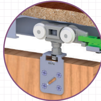
SKS 51 Y 2 05 072